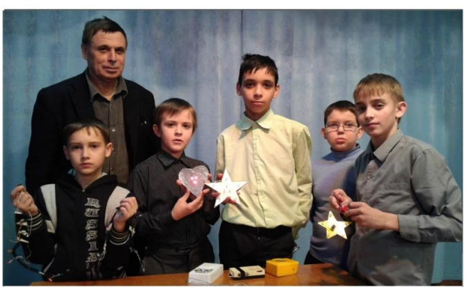
СЛАВНЫЕ ТРАДИЦИИ (стр. 6)