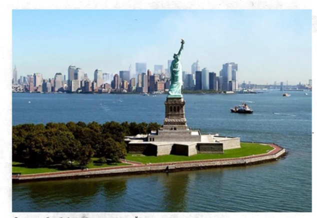
Статуя Свободы в Верхней Нью-Йоркской бухте

из страны, они-надеялись на лучшую жизнь. Но не всё сложилось так, как хотелось. Видимо признаться себе, что надежды не оправдались, не хватает духу, поэтому проще клеймить бывшую Родину и превозносить мнимую американскую свободу. Тот, кто думает, что живёт хорошо, просто-напросто заблуждается, ибо пропаганда чрезвычайно сильна: американцы самые богатые, Америка – это рай... Люди верят в рекламу, так же как и в «права человека», которых попросту нет. Американцы не знают свою историю и даже не хотят её знать. Общаться там просто не с кем. Негры, которых там называют афроамериканцами, не любят белых, белые не любят негров и многих других. Поэтому все живут обособленно. А если ты ещё и не очень хорошо говоришь по-английски, то дело совсем плохо. На работу берут только с хорошим английским и при наличии документов. Поэтому вся работа в Америке делится на рабов и работодателей.