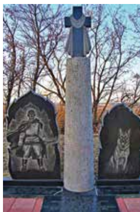
Памятник в с. Легедзино (Украина)

Заканчивался июль 1941-го. Отдельный батальон погранвойск под командованием майора Лопатина прикрывал отход штабных частей Уманской группировки. В состав батальона входило 500 пограничников и 150 служебных собак. На войне собакам трудно. Нет условий содержания, нет корма, даже выгулять собаку нормально нельзя.