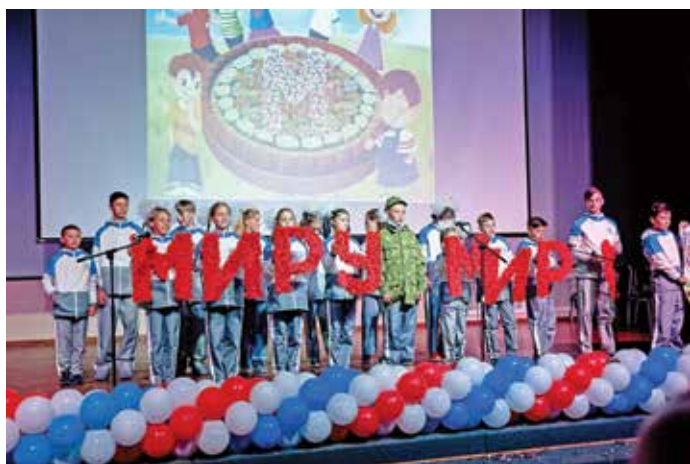
На сцене команда «Дети Донбасса»

Детские спортивные Олимпиады стали теперь ежегодным благотворительным спортивно-массовым мероприятием в поддержку воспитанников детских домов и школ-интернатов. Основные задачи Олимпиады – привлечение детей к регулярным занятиям физической культурой и спортом, отвлечение от пагубных привычек и противоправных действий, воспитание характера на основе общечеловеческих ценностей, привлечение внимания широкой общественности к проблемам детей-сирот.