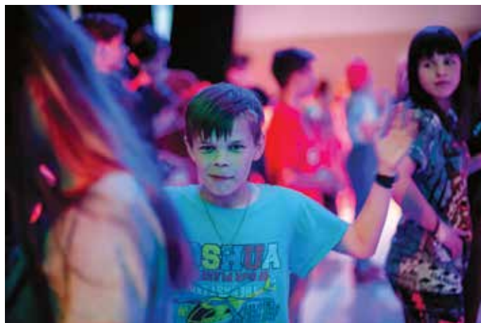
А вечером для всех дискотека