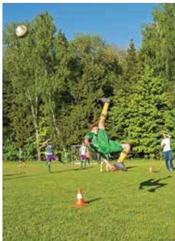
Вот это удар!

практический опыт был особенно интересен и полезен слушателям.