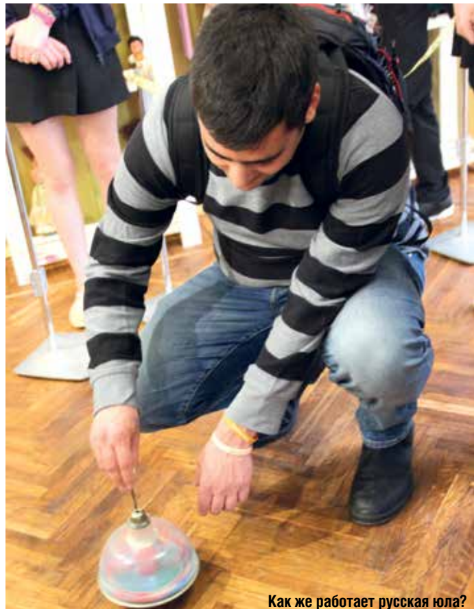
Как же работает русская юла?